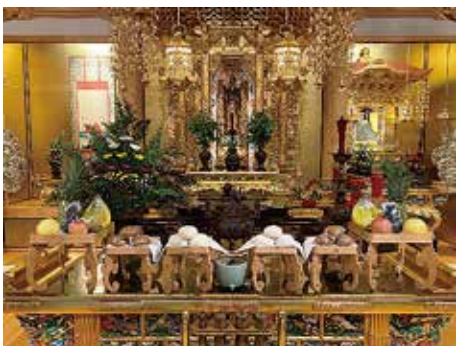
西別院で行う法事の供物

「おさがり」とは…仏様にお供えたものを、自分たちが頂くことを指します。自分たちが先に口にするのではなく、先に仏様にお供えをするというお敬いの心が込められています。