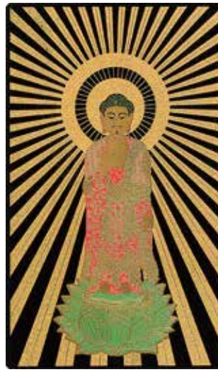
■携行本尊（絵像） 一幅 10,000円