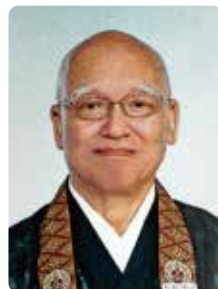
熊本教区 玉関組 正元寺 寺添 和南師