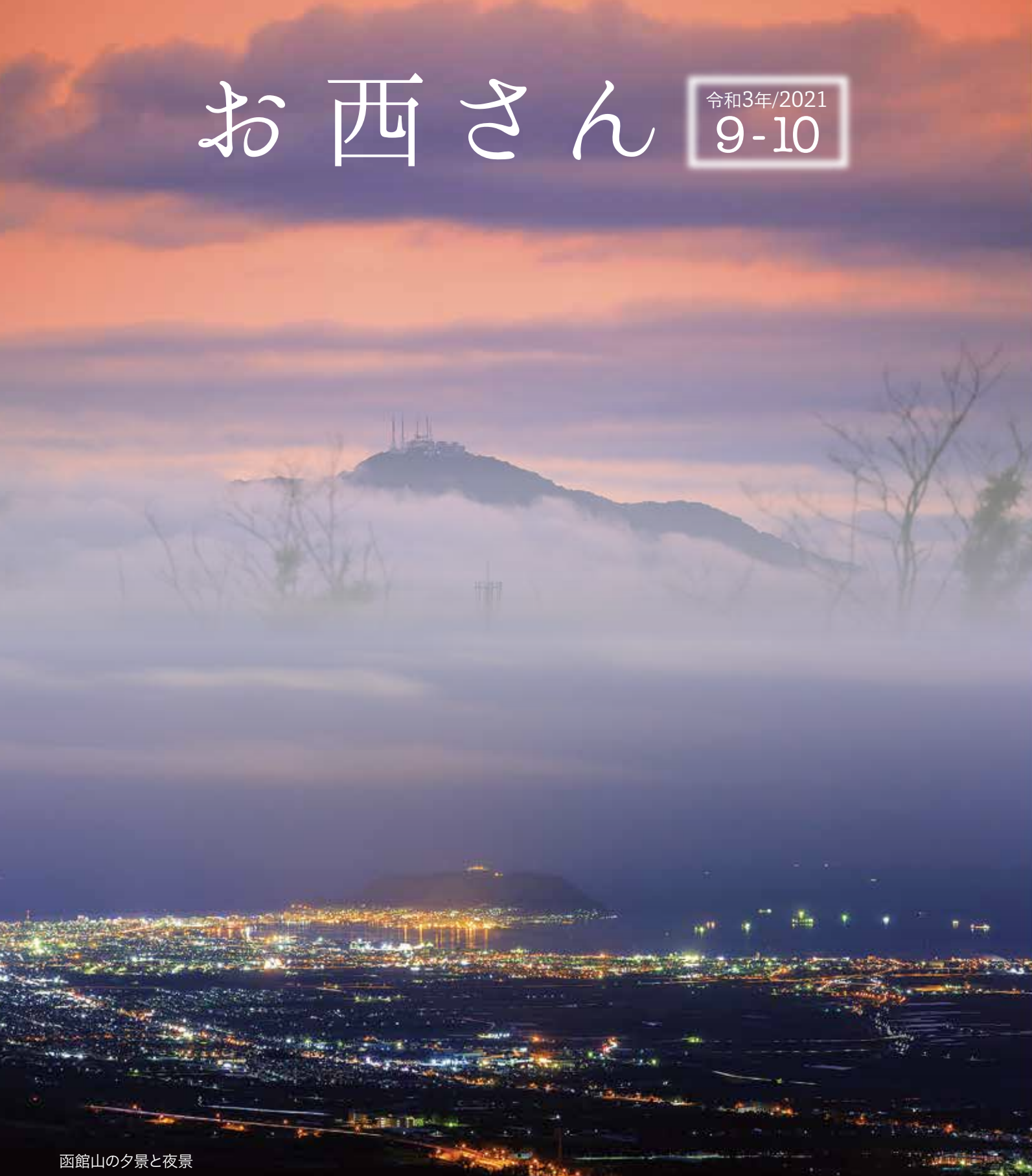
函館山の夕景と夜景