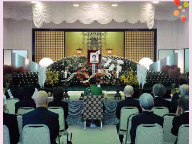
写真はお通夜の様子