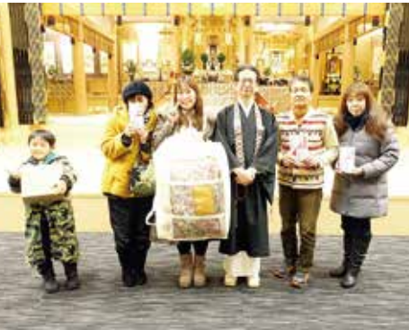
お楽しみ抽選会当選者