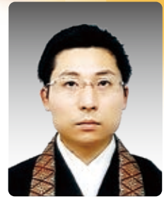
北海道教区 函館組 宣法寺