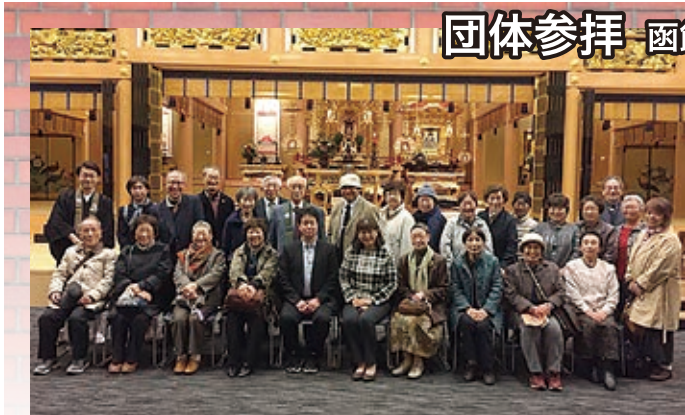
奥羽教区青森県第2組(大谷派) 御一行様