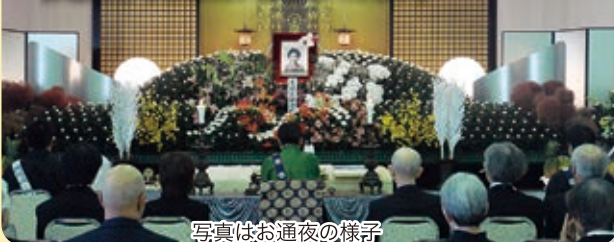
写真はお通夜の様子

西別院文化会館でお葬儀会場としてご使用できます。 詳細はお寺にお問い合わせください。