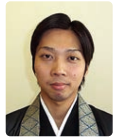
兵庫教区 阪神西組 眞光寺