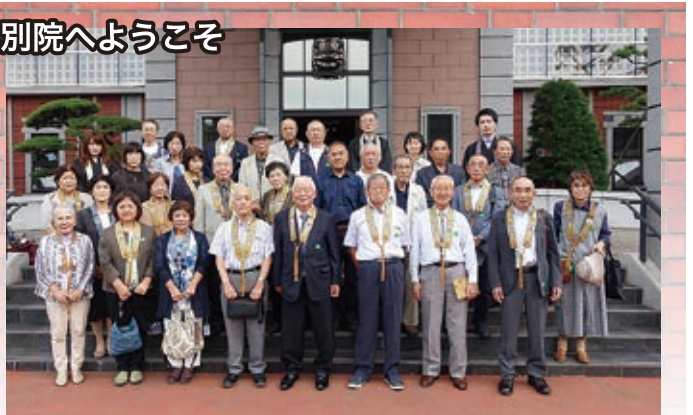
東北教区 宮城組 眞光寺御一行様