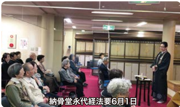
納骨堂永代経法要6月1日