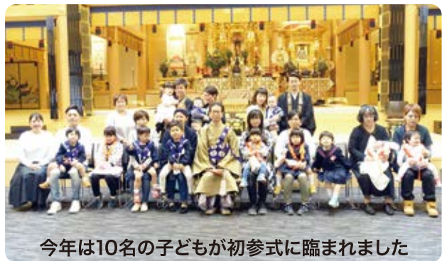
今年は10名の子どもが初参りに臨まれました