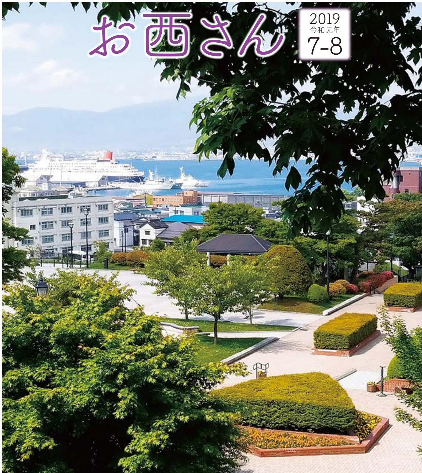
元町公園から函館湾の豪華客船を見る