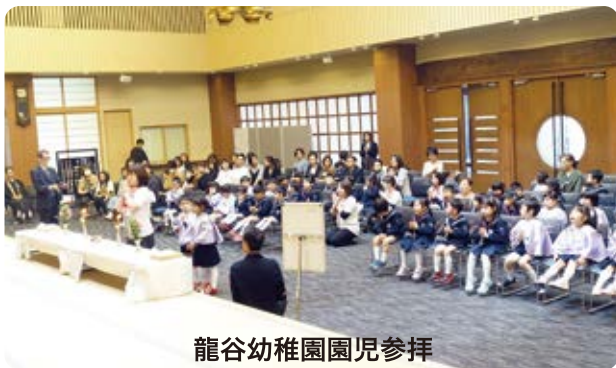
龍谷幼稚園園児参拝