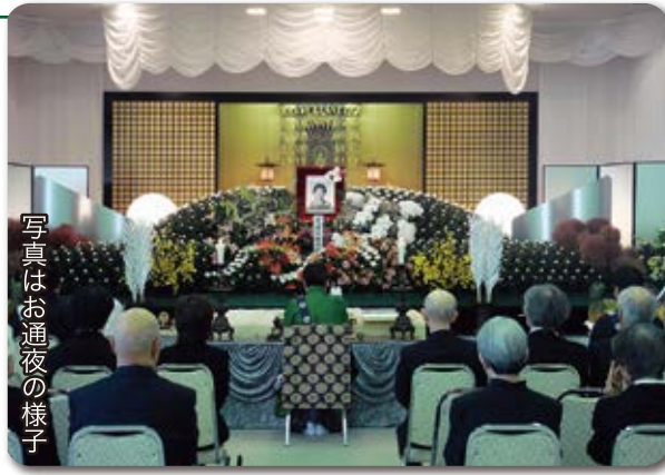
写真はお通夜の様子

西別院文化会館でお葬儀会場としてご利用できます。詳細はお寺にお問い合わせください。