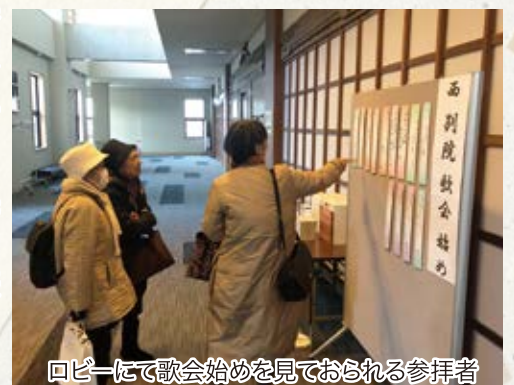
ロビーにて歌会始めを見ておられる参拝者