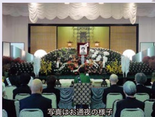
写真はお通夜の様子