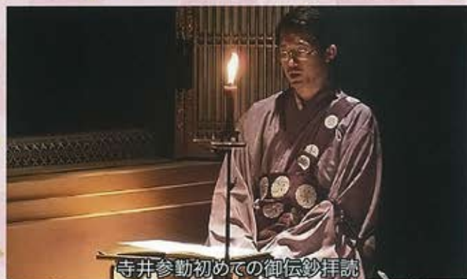
寺井参勤初めての御伝抄拝読