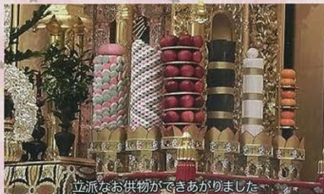
立派なお供物ができあがりしました