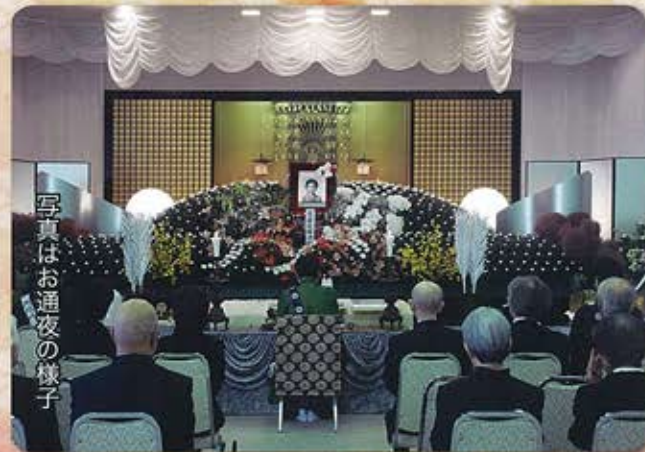
写真はお通夜の様子

西別院文化会館でお葬儀会場としてご使用できます。詳細はお寺にお問い合わせください。