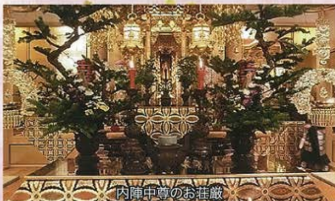
内陣中尊のお挂敵