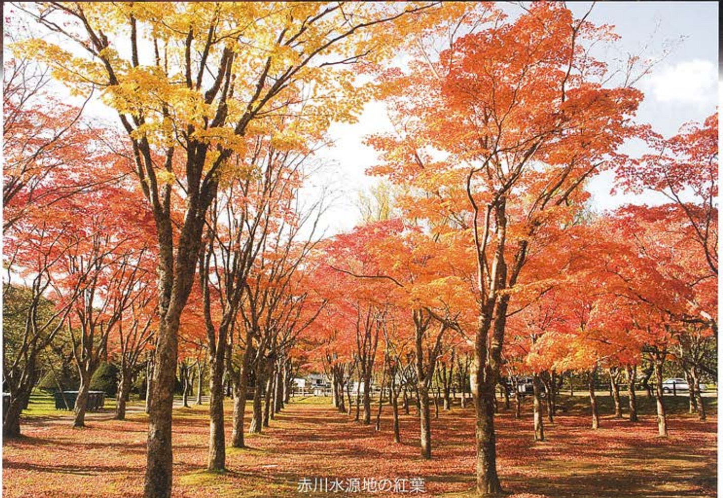
赤川水源地の紅葉