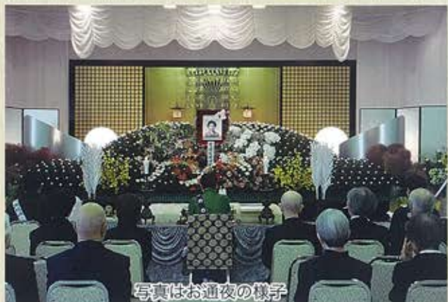
写真はお通夜の様子