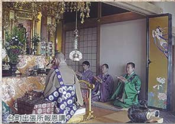
台町出張所報恩講