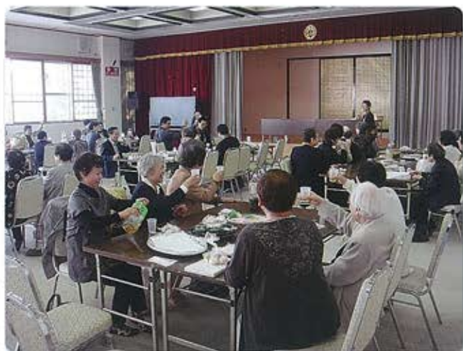
5月23日降誕会よろこびの広場