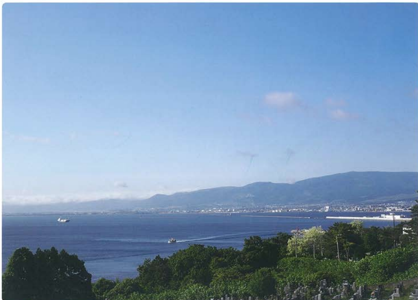
西別院台町墓地より函館湾を臨む