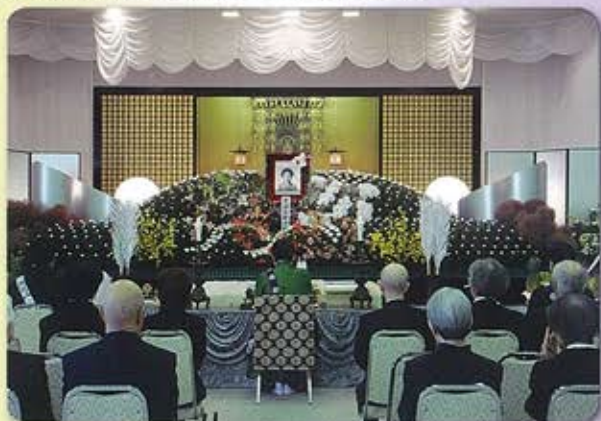
写真はお通夜の様子

西別院文化会館でお葬儀会場としてご使用できます。詳細はお寺にお問い合わせください。