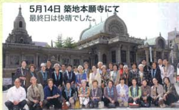
5月14日 築地本願寺にて 最終日は快晴でした。