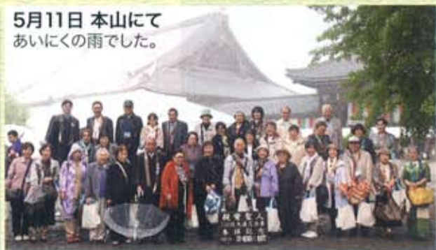
5月11日 本山にて あいにくの雨でした。