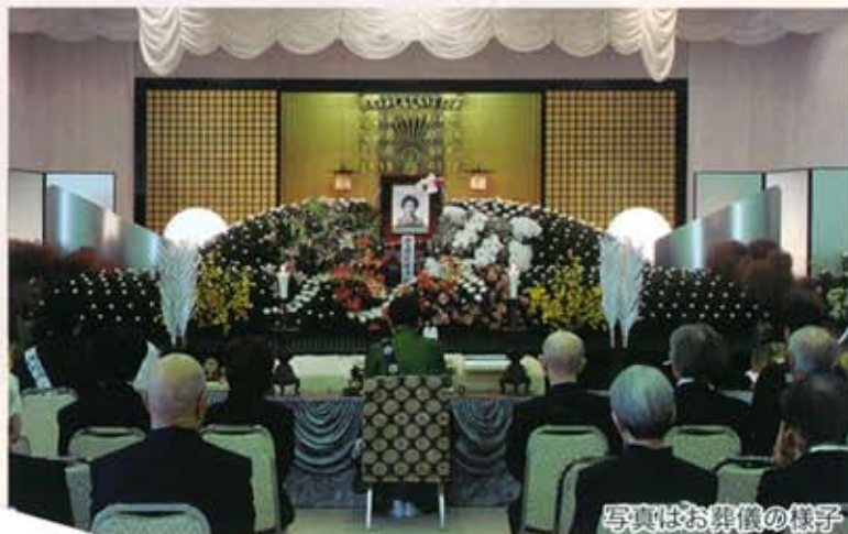
写真はお葬儀の様子