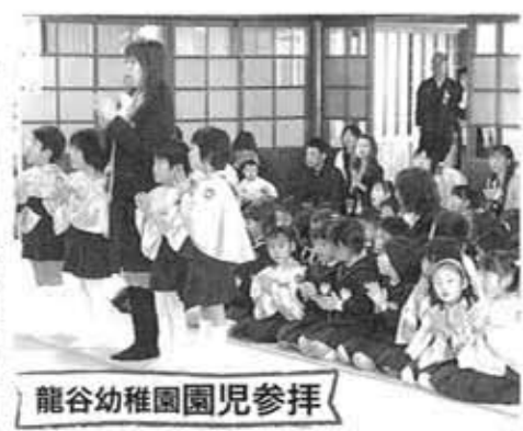
龍谷幼稚園園児参拝