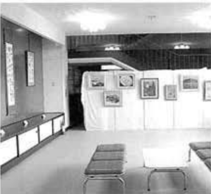
ご出展ありがとうございました。