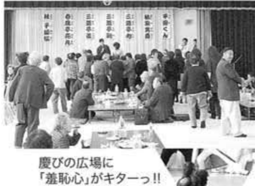
慶びの広場に「羞恥心」がキターっ!!