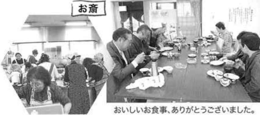
おいしいお食事、ありがとうございました。