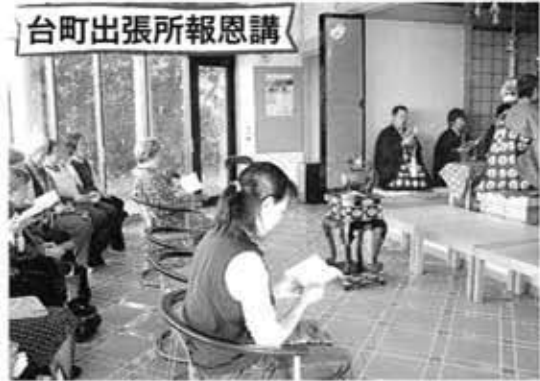
台町出張所報恩講