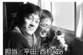
担当/平田・西村(玄)