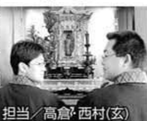
担当/高倉・西村(玄)