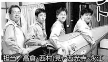
担当/高倉・西村(晃)・西光寺・永江