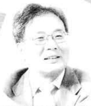
大阪教区 大阪北組 光明寺