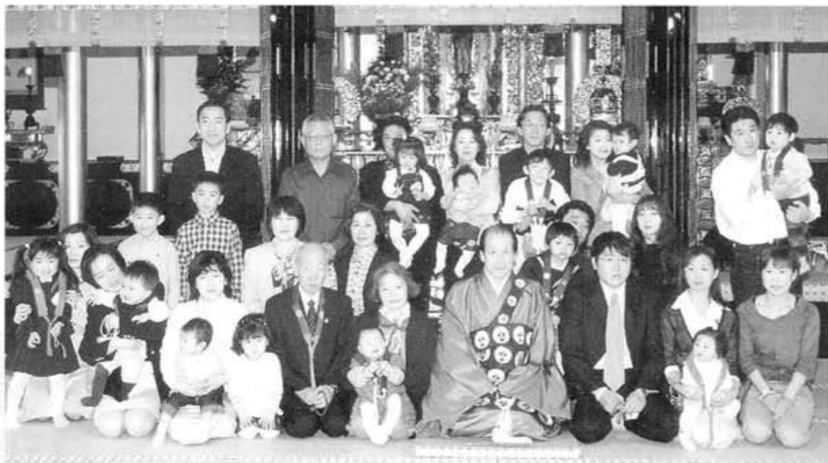
平成十四年度 初参式

時代を越えて歌いつがれていく演歌。人びとの心の機微にふれて親しまれていますが、その多くの歌詞に地名が書かれていて、訪れたことのない地であっても想像することが出来ます。