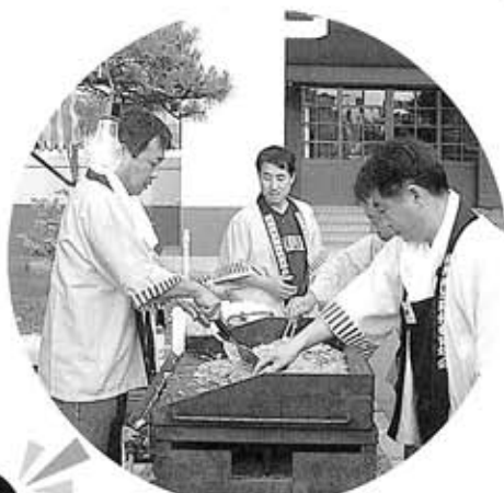
●おいしい焼きそば作るぞ!!