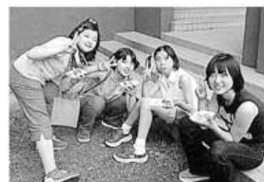
●私達、仲よし四人組で～す