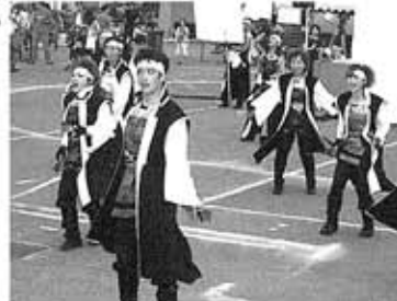
●YOSAKOIチームのみなさん