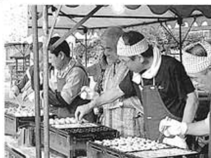
●おいしいたこ焼きいかがですか～

くれぐれもお体を大切に、お元気で お念仏を御相続されます事を心より 念じ申し上げます。ありがとうございます ました。