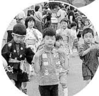
●上手に踊れたかな?