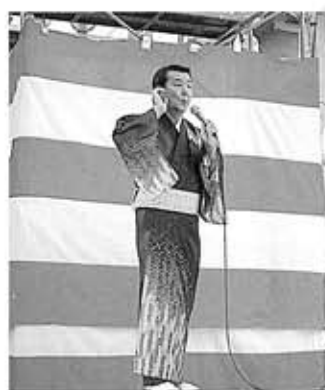
●千扇さんオンステージ!!