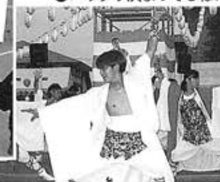
●バッチリ決まってるね!!