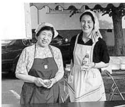
●二人揃って、ハイ、ポーズ!!