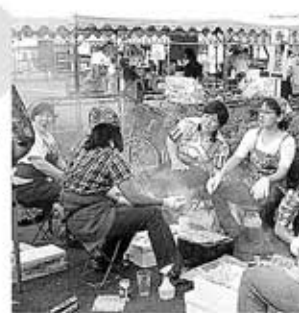
●煙が目にしみます

去る7月21日盆踊りが開催されました。盆踊りは、皆様からの多額の提灯献灯料並びに協賛想志によって大盛況のうちに幕を閉じることができました。来年も新しい企画・内容で楽しめる盆踊りを開催したいと思っております。これからも変わらぬご支援・ご協力の程、宜しくお願い申し上げます。