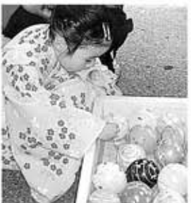
●どれにしようか迷っちゃうね。