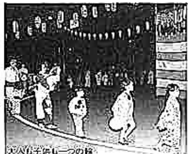
次女(お西さん)の絵