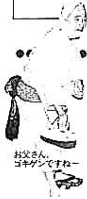
お父さん、ヨキゲンですねー

昨年以上の賑わいだっただ盆踊り。 出店等を出して下さった各教化団体の 皆さん御協力 ありがとうございました。