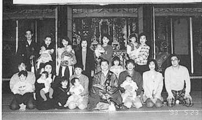
▲はじめてのお寺参り初参式