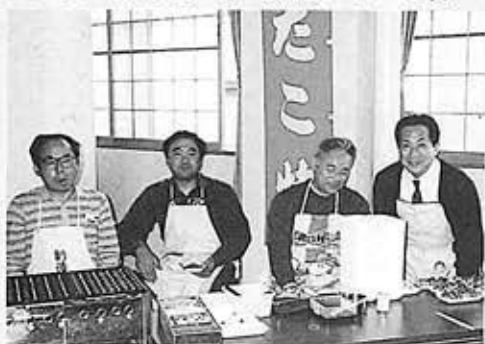
▲今やプロの腕前? 壮年会の皆さんです。