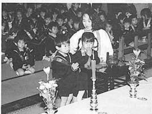
▲とてもかわいらしく ほほえましかった 園児参拝