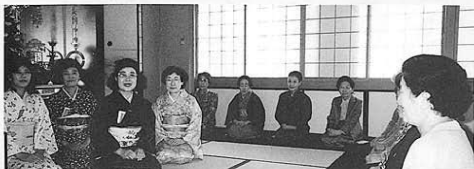
▲さあ、ひと休み、おいしいお茶のコーナーです。