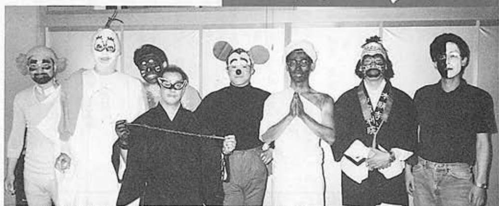
▲笑いの中でおみゆりを、大ざり説法(だれがだれだかわかりますか?)