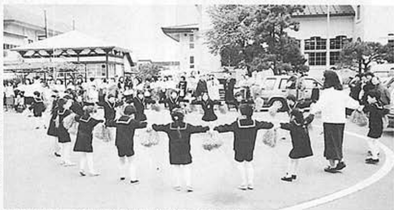
▲きれいでしょう/龍谷幼稚園によるマスゲーム